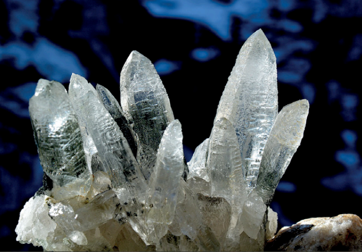
Bergkristall vom Kaltwasserpas ob dem Simplonpass

MAGISCHE STEINE SELBER FINDEN - MIT UNSERER HILFE WIRD DAS ZU EINER FASZINATION