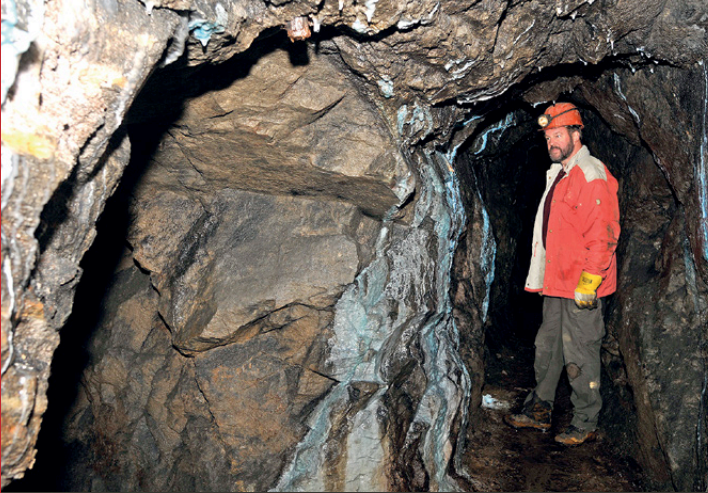
Minenforscher in der Stockalper-Mine aus dem 17. Jh.

ERLERNEN SIE VOM PROFIL, WO UND WIE MAN AM BESTEN IN DEN ALPEN GOLD FINDET